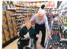
ランチ&買い物レク