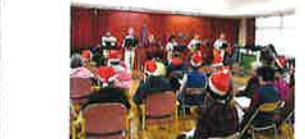
手作りおやつ (白玉ぜんざい)