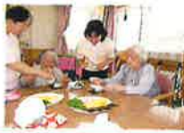
手作りおやつ (手巻き寿司)