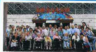
夏の遠足【須磨海浜水族園】